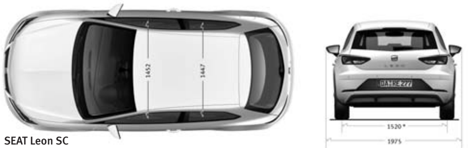
SEAT Leon SC